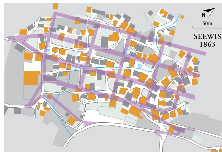
edifizis ars giu nova rait da vias