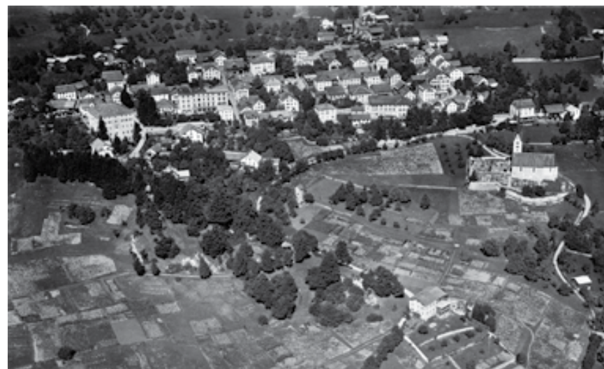
11.09 Fotografia or da l'aria da Seewis, 1923

Per il temp avant il 20. tschientaner èn fin ussa vegnids analisads istoricamain incendis da guaud en il Grischun mo punctualmain per singulas