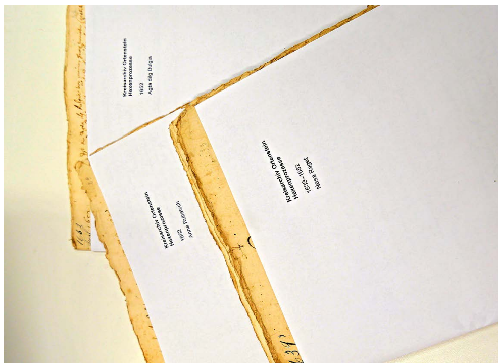
Die Hexenprozessakten des Gerichts Ortenstein in frisch beschrifteten Mappen.

Regelmässige Leserinnen und Leser des «Pöschtl» mögen sich gefragt haben, wo in diesem Bericht die Kulturarchive blei-