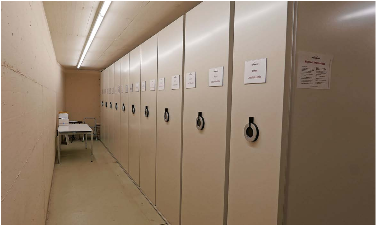
Die hochmodernen Rollregale des Regionsarchivs Viamala im Rathaus Thusis.