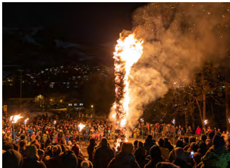
Hom Strom in Scuol.