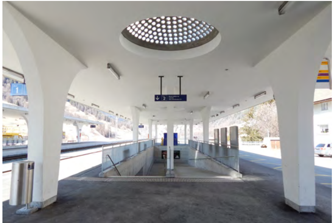
Das architektonisch auffällige Perrondach des Bahnhofs Zernez.