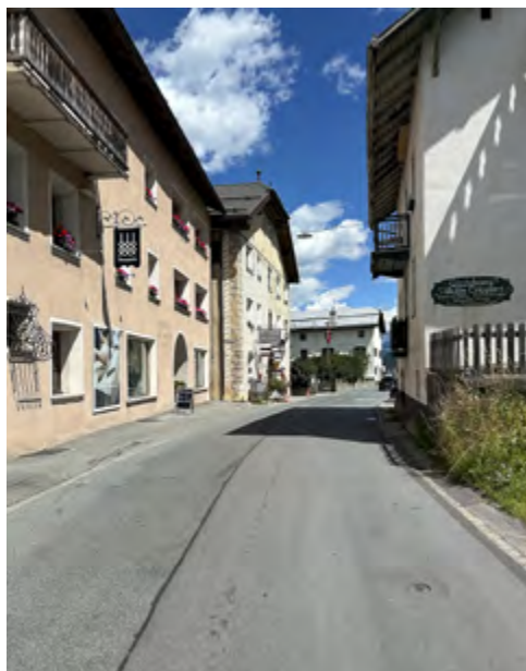
Sta. Maria und die weiteren Münstertaler Orte sind als Strassendörfer angelegt.