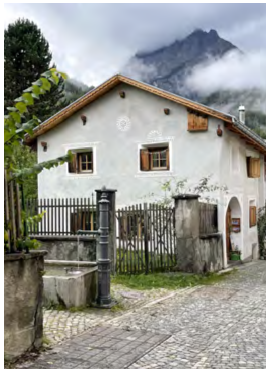
Rechts Zeitgenössischer Brunnen in Ramosch.