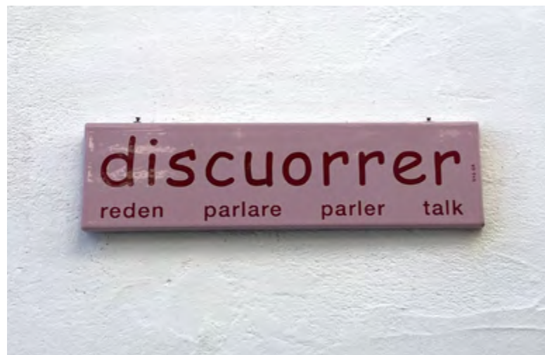
Häuserfassade in Vnà.

Das Samnaunerdeutsch ist ebenfalls nach wie vor fester Bestandteil des sprachlichen Alltags in Samnaun. Samnauner:innen sprechen heute drei, teilweise auch vier Varietäten des Deutschen. Neben Standarddeutsch und Samnaunerdeutsch sind dies Dialekte, die umgangssprachlich als «Tirolerdeutsch» und «Bündnerdeutsch» bezeichnet werden. In Samnaun wird das Samnaunerdeutsch scherzhaft auch die «fünfte Landessprache» genannt (Oberholzer 2024).