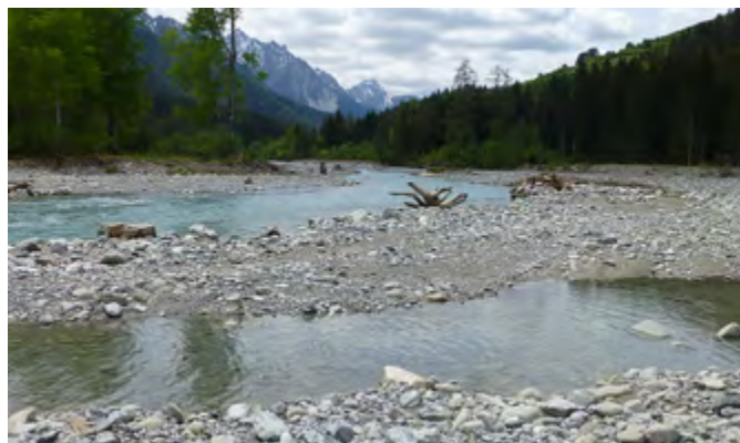
Renaturierung der Innauen bei Panas-ch, Ramosch, 2020.