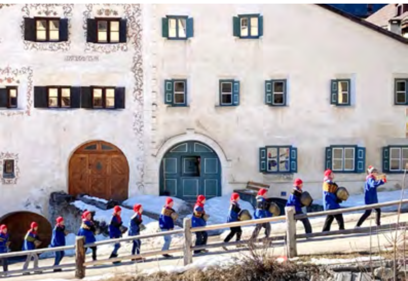
Chalandamarz in Lavin, 2025.