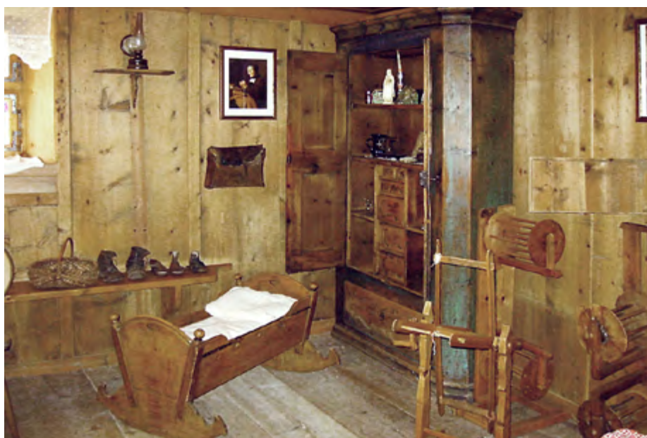
Talmuseum Chasa Retica, Samnaun-Plan.