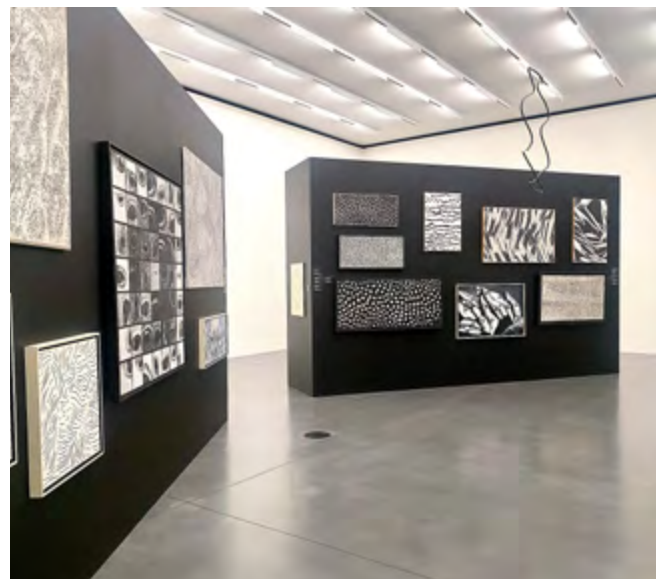
Museum Susch: Rauminstallation in der Ausstellung Jadwiga Maziarska.