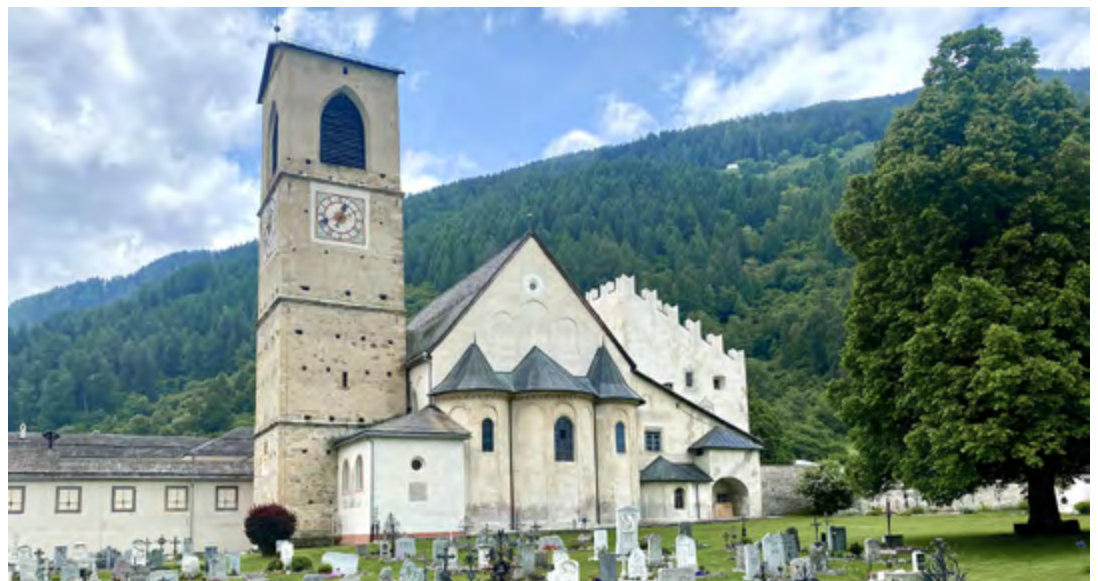
Kloster St. Johann, Müstair.