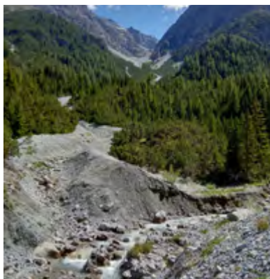
Landschaftsentwicklung in der Val Zuort, Tarpasp, 2020.

Unter «Landschaft» ist ein Teil der Erdoberfläche zu verstehen, der eine gewisse räumliche Einheit bildet, in unserem Fall die Region Engiadina Bassa/Val Müstair. Die Landschaftskunde setzt sich aus naturgeografischen (Geologie, Klima, Hydrologie, Bodenkunde, Flora und Fauna) und anthropogeografischen Faktoren (Bevölkerung, Siedlungen, Verkehr, Wirtschaft, Politik, Kultur) zusammen. Um die gegenwärtige Kulturlandschaft zu verstehen, ist ein Blick auf die Naturlandschaft und ihre stetigen Wandlungen zu werfen. Geomorphologische Übersichten in Form von Führungen und Exkursionen sind von Nutzen, sie schärfen die Sicht auf Prozesse, die sich mittlerweile durch menschliche Eingriffe multiplizieren. Die Entstehungsgeschichte der Landschaft ist durch verschiedene Kräfte und Gegenkräfte geprägt, insbesondere das Ineinandergreifen fluvialer und glazialer Vorgänge (Talprofile, Mündungsschluchten, Schuttfächer, Karseen, Moränen, Deltaablagerungen, Felsstürze). Der gut sichtbare Kampf zwischen Erosion, Denudation (Abtragung) und Akkumulation (Ablagerung) ist faszinierend. Der allmähliche Übergang in eine Kulturlandschaft ist durch mannigfache menschliche Tätigkeit geprägt, die gelegentlich durch Renaturierungen korrigiert wird. Hier sind Begehungen attraktiv.