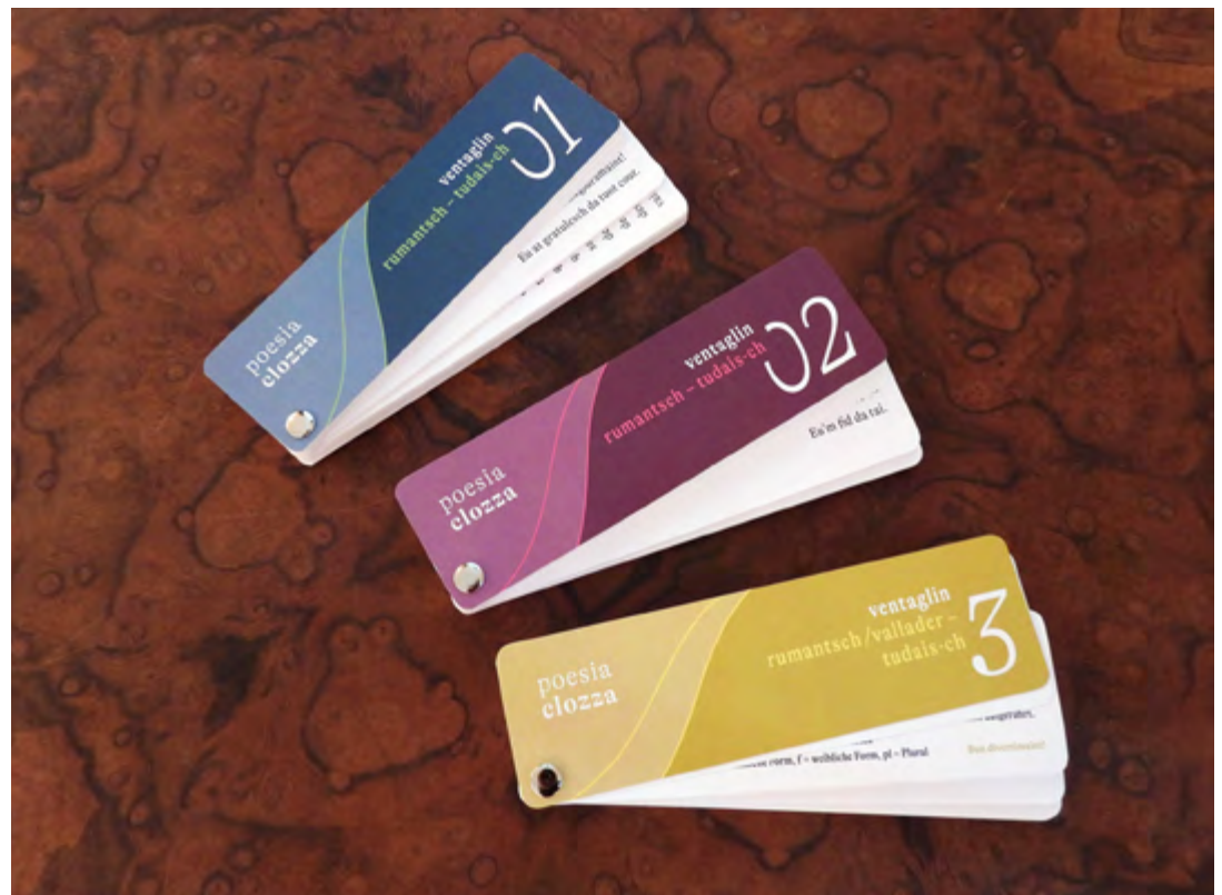
Rätoromanischlehrmittel «Ventaglin» der Libreria Poesia Clozza.