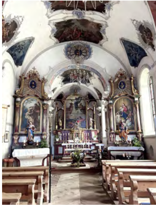
Die St. Jakobuskirche in Samnaun-Compatsch mit üppigen Barockmalereien (l.) und die modernisierte Kirche Maria da Caravaggio, Müstair (r).

Zahlreiche Kirchen in der Region sind interessant, weil sie teils sehr alt und mit archaisch anmutenden Bänken ausgestattet sind. Berühmt sind die Malereien in Lavin. Die Kapelle in Sur En d'Ardez und das grosse Gotteshaus in Ramosch haben aussergewöhnliche Bänke. Am bekanntesten ist das zum UNESCO Weltkulturerbe zählende Kloster St. Johann Müstair, dessen Geschichte umfangreich erforscht und dokumentiert ist. Das Kirchenwanderbuch von Köbi Gantenbein und Ralph Feiner beschreibt alle Unterengadiner Gotteshäuser und ergänzt die Beschreibungen mit geschichtlichen Details.