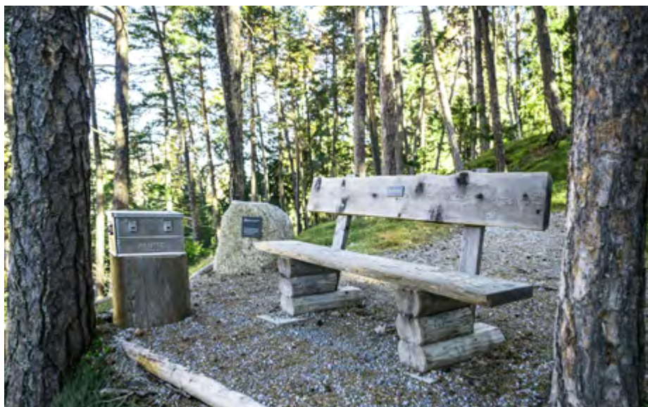
Dürrenmatt-Bank mit Bücherkiste oberhalb von Vulpera.

Allgemein zu erwähnen ist die Funktion der Region als temporärer Rückzugsort für literarisches Schaffen und Inspiration. Während in der Vergangenheit das Grandhotel Waldhaus in Vulpera für Dürrenmatt und andere Autor:innen als Schreibort und Inspirationsquelle diente, übernimmt das Kulturzentrum Nairs heutzutage diese Funktion für Kunstschaffende und Autor:innen aus aller Welt.