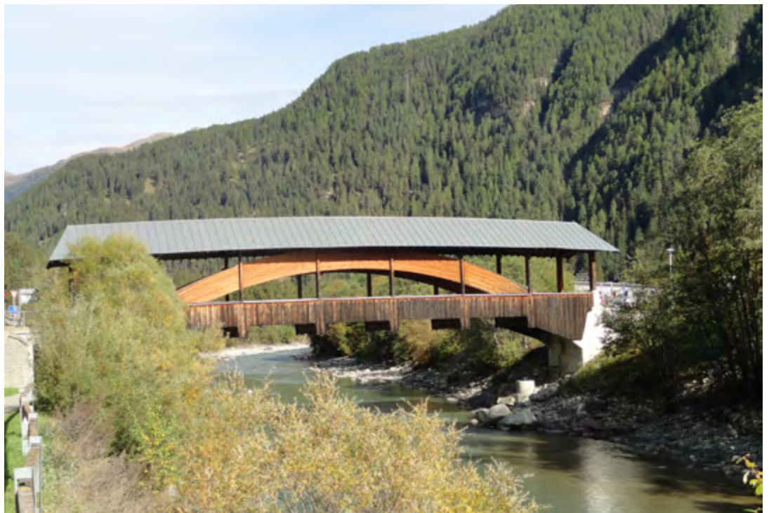
Gedeckte Holzbogenbrücke Sclamischot.