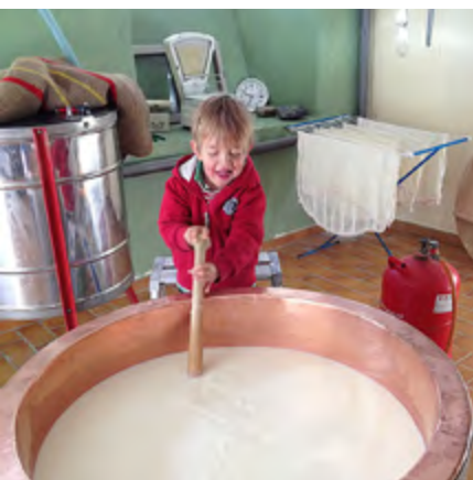
Käsen mit Kindern.