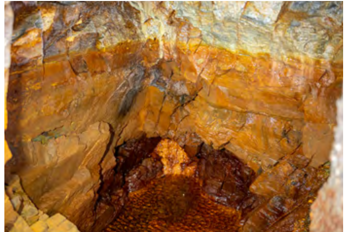
Rechts Die Sotsass-Quelle in Scuol.

Nachfolge des Badehauses im Jahr 1993 das Bogn Engiadina als Wellnessbad eröffnet wurde. Seither kann in Scuol wieder gebadet und ein breites Wellness-Angebot genossen werden.