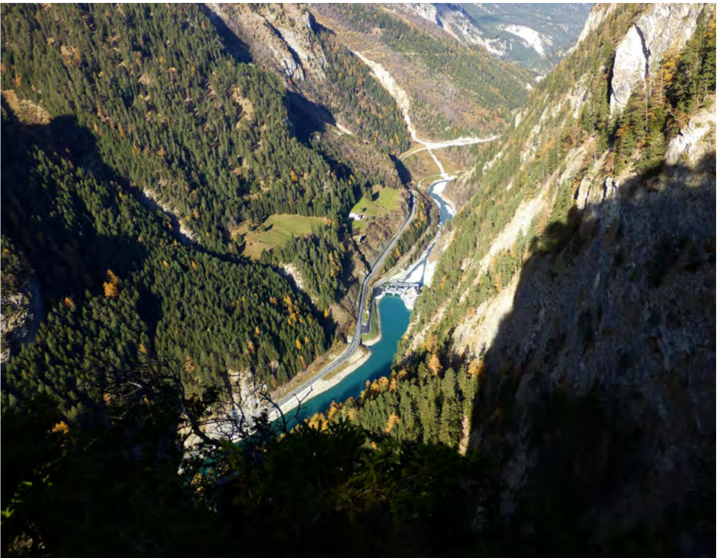
Innkraftwerk bei Ovella, 2024.