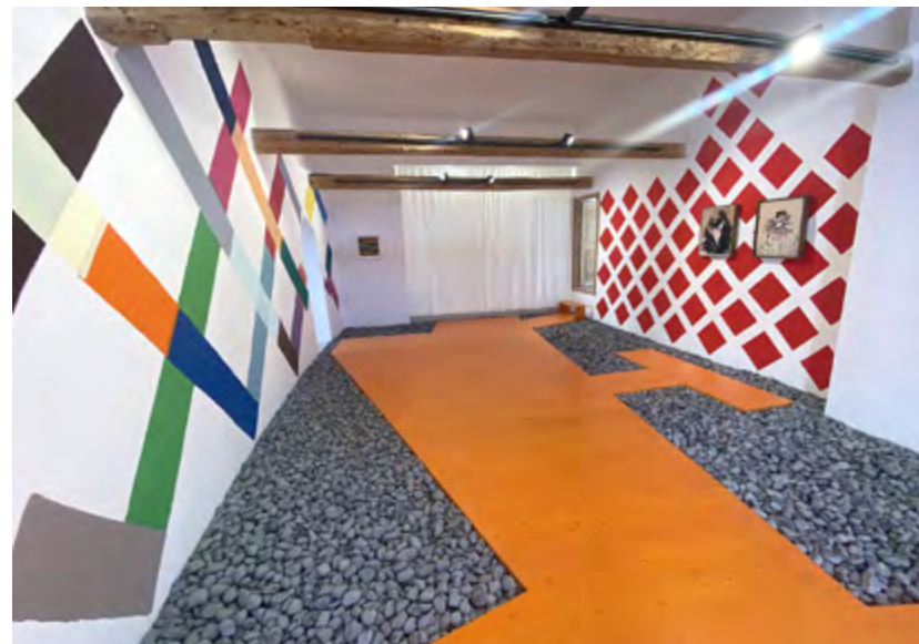
Ardez: Raumkonzept in der Casa Sperlavia, projectoamil (Roni Horn und Martin Creed).