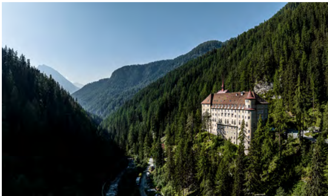
Das Kurhaus in der Val Sinestra.