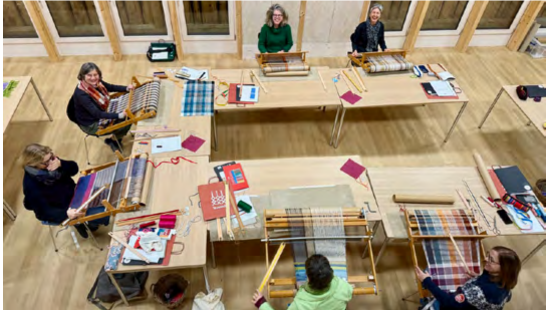
Webkurs in der Tessanda.

Das Rohmaterial gewannen die Frauen selber, entweder aus der Wolle der Schafe oder aus angebautem Flachs oder Hanf. Von diesem waren aber nur die weiblichen Pflanzen verwertbar. Allerdings war die Getreideaufbereitung sehr aufwändig und verlangte verschiedene Arbeitsschritte. Nach der Ernte wurden die Pflanzen geriffelt oder ausgeklopft und danach zu Garben gebündelt in Wasserbäder gestellt, bis die hölzernen Bestandteile verfaulten. Zu Hause wurden die getrockneten Garben auf den Brechstühlen bearbeitet, schliesslich gehechelt und zu Garn gesponnen, welches dann wiederum zu den Weberinnen kam. Mittlerweile steht in kaum einem Haus mehr ein Webstuhl, dafür rund 30 von ihnen in der Tessanda Sta. Maria in der Val Müstair, einer der letzten professionellen Handwebereien der Schweiz. Auf diesen Webstühlen arbeiten 20 Handweberinnen und verarbeiten die angelieferten Garne zu Geweben. Die Arbeit ist praktisch noch die gleiche wie früher und verströmt, unterstützt durch lautes Klackern und Gepoltere und den feinen Duft der Garne, einen Hauch von Vergangenheit. Seit einiger Zeit arbeitet die Tessanda auch daran, ihren Rohstoff oder zumindest einen kleinen Teil davon, selbst herzustellen. Dazu bauen einige Landwirtschaftsbetriebe im Tal wieder Flachs an. Ein Teil davon wird dann im Herbst in fast schon zeremonieller Art an der «Flachsbrächete» gebrochen und schliesslich zu Garn weiterverarbeitet. Dieses gelangt schlussendlich auf den Webstuhl, wo es zum Gewebe wird.