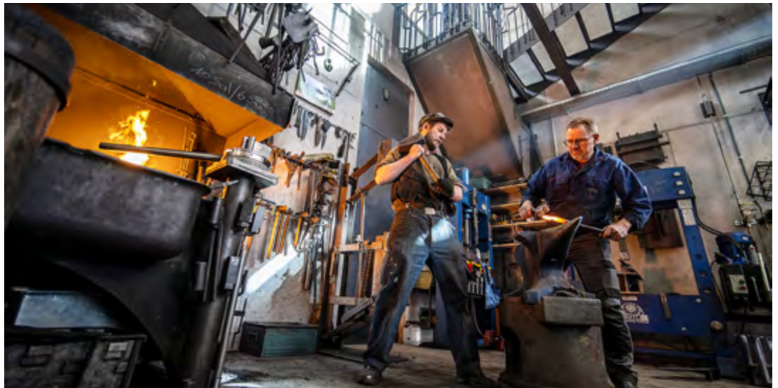
Messerschmiede Giarsun, Guarda.

Feuer und stellte verschiedene Werkzeuge, Messer oder Pfannen her, aber auch Geländer, Kunst und Eisenwaren aller Art. Daneben betrieb er eine kleine Metallwerkstatt in Giarsun, dem Weiler unterhalb Guardas. Vor einigen Jahren hat er all seine Tätigkeiten in einem Neubau in Giarsun vereint, selbstverständlich inklusive Esse. Dieses Gebäude des Architekten Urs Padrun hat die Auszeichnung «Gute Bauten Graubünden» gewonnen. Bei diesem Bau war der Vermittlungsgedanke bereits mitgedacht, denn Lampert hat das Interesse der Gäste an diesem Handwerk erkannt. Von einer Besucherrampe können Interessierte dem Schmied bei der Arbeit zuschauen. Führungen und ein breites Kursprogramm ergänzen das touristische Angebot. Die Kurse werden in Zusammenarbeit mit pro manufacta engiadina angeboten und sind sehr begehrt. Ein Ausbau des Angebots ist aus Kapazitätsgründen nicht möglich.