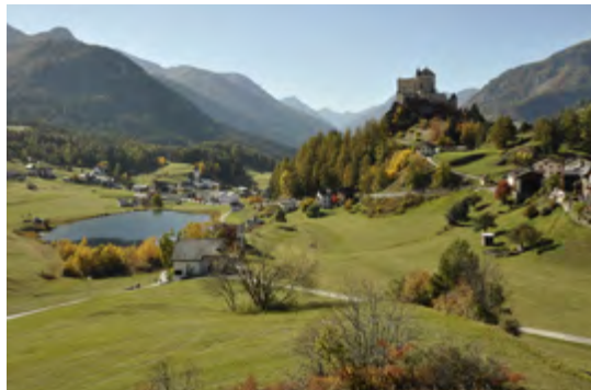
Rechts Siedlungs- und Kulturlandschaft Valchava und Sta. Maria, 2011.