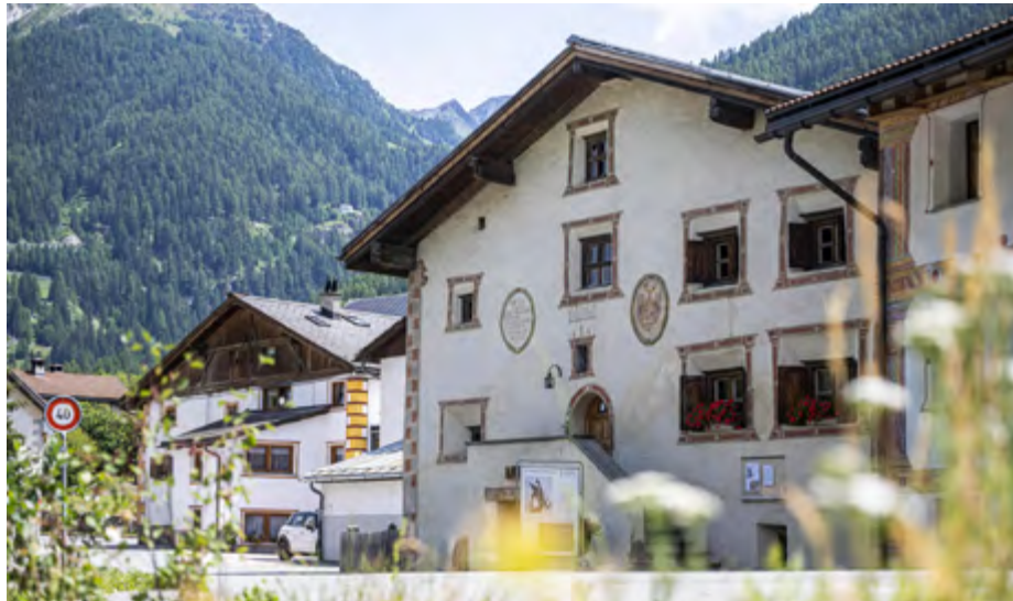
Chasa Jaura in Valchava.