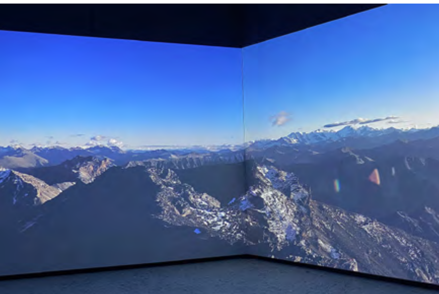
Zentrum Nationalpark, Videoprojektion.

Eingebunden in den Schweizerischen Nationalpark bietet das Haus einen Einblick in die wissenschaftliche Forschung und die Besonderheiten der einmaligen regionalen Flora und Fauna. Es wird über gesellschaftlich wichtige Themen wie Biodiversität und Klimawandel am Beispiel des Wildnisgebiets informiert. Mit einem Ertrag von CHF 522 000 allein aus Besuchen des Zentrums (Schweizerischer Nationalpark 2024: 67) ist es das besucherstärkste Haus der Region, viel Publikum dürfte auch über pädagogische Besuche (z. B. von Schulklassen) erzielt werden. Die wissenschaftspädagogischen Angebote im Nationalparkzentrum – das vom Bündner Architekten Valerio Olgiati gestaltet wurde – werden ergänzt durch die Pflege der Wanderwege, die Durchführung von Exkursionen sowie besondere Veranstaltungen wie das Kino Open Air. Angeschlossen ist zudem ein Museumsshop, auch gibt es ein Auditorium für grössere Veranstaltungen. Die Kommunikation des Nationalparks ist aus Sicht potenzieller Besucher:innen klar und informativ. Sie entspricht einem «gehobenen Standard» gemäss Leitfaden des Deutschen Museumsbundes (Deutscher Museumsbund 2023).