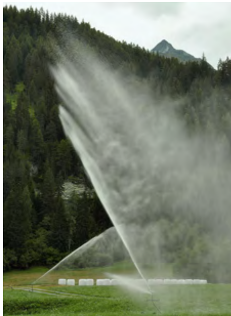
Moderne Beregnung und Siloballen, Sciamischot, 2023.