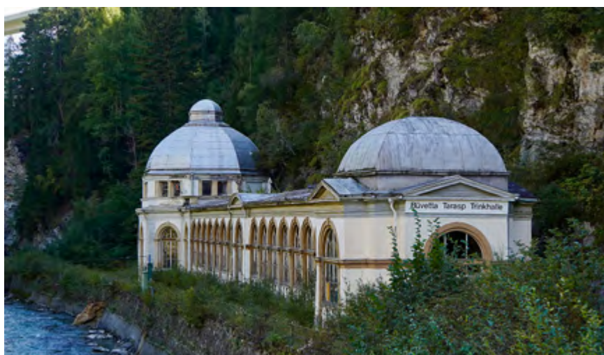
Die Büvetta in Nairs.