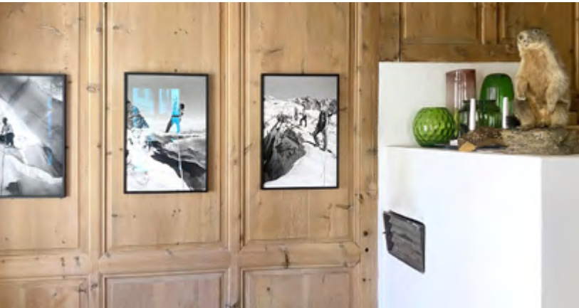
Galerie Curuna Ardez: Die Ausstellung «Bilder eines Jahrhunderts: Die Fotografendynastie Feuerstein 1871–2004».