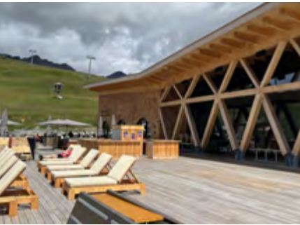
Neubau auf Motta Naluns im Skigebiet oberhalb von Scuol.

Zu den wichtigen und architekturgeschichtlich interessanten Kulturbauten gehören die Museen. Historisch interessant sind die Ortsmuseen Scuol, Valchava, das Museum im Kloster Müstair, die Chasa Retica in Samnaun-Plan und die Stamparia in Strada. Zeitgenössische Architektur zeigen das Nationalparkgebäude in Zernez und das Muzeum in Susch. Im weiteren Sinn als Kultureinrichtung kann auch der Parkin Not dal Mot in Sent und der Turm zur Betrachtung des Sonnenuntergangs beim Schloss Tarasp gezählt werden. Architektonisch interessante Lösungen zeigen sich in verschiedenen historischen Gebäuden, die zu Galerien umgenutzt sind, namentlich in Ardez und Sent. Auch die touristische Infrastruktur wird heute architektonisch bewusster gestaltet. Beispiele sind der Neubau auf Motta Naluns im Skigebiet von Scuol oder die Team Lodge der Bergbahnen Samnaun (vgl. Kapitel «Kunst und Museen»).