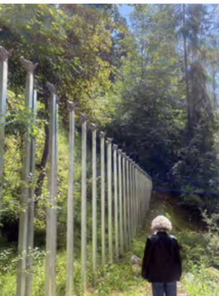
Parkin Sent: Kunstinstallationen und Landschaftsarchitektur Not Vital.

Das Kloster St. Johann, das auf die karolingische Zeit zurückgeht, ist UNESCO Weltkulturerbe und ein «Zeuge christlicher Hochblüte um 800». Es ist einmalig als Gebäude erhalten, zeigt den «grössten, besterhaltenen Wandmalereizyklus aus dem Frühmittelalter» sowie eine Statue Karls des Grossen (muestair.ch). Bis heute wird es durch Benediktinerinnen belebt. Teile des Klosters können im Rahmen von Führungen besichtigt werden, die Kirche und das Museum stehen Besucher:innen offen. Der Schwer-