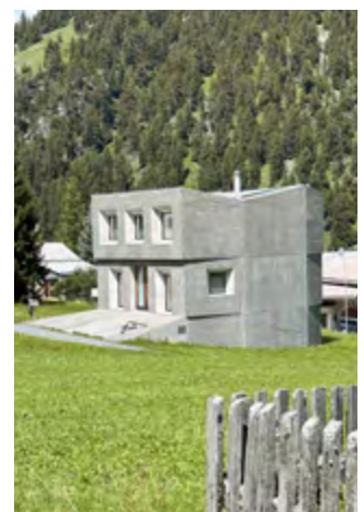
Zeitgenössische Architektur gibt es in allen Orten, beispielsweise: Industrie- und Gewerbezone von Müstair (l.), das Haus Presenhuber in Vnà (m.) und das Haus Illien in Sta. Maria (r.).