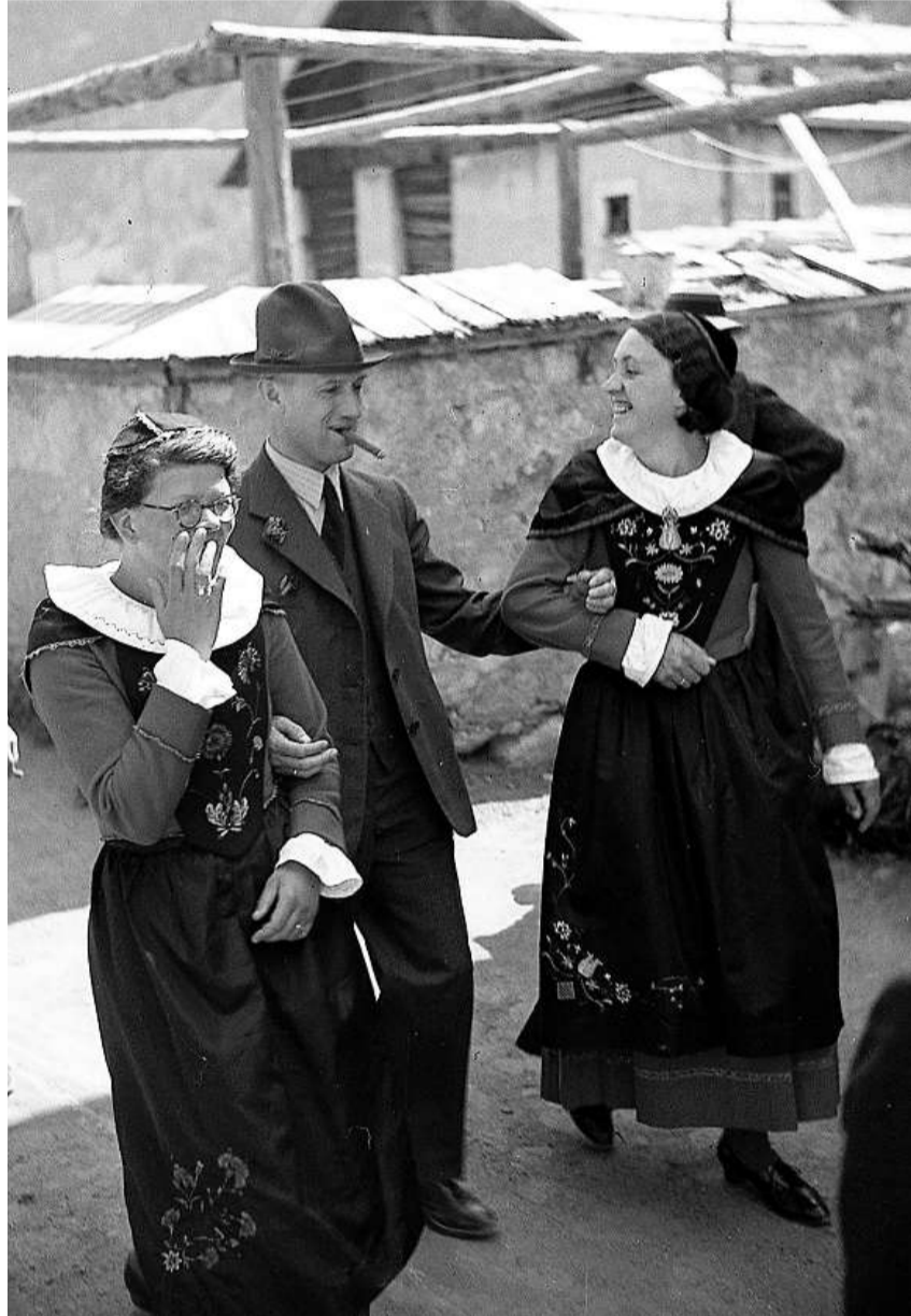
Schulterschluss mit einheimischem Brauchtum: Bundesrat Philipp Etter und seine Mitstreiter setzten im Abstimmungskampf auf die Mithilfe von Trachtenvereinen und Heimatschützern.

Wie kam es zu diesem erstaunlichen Resultat und wer unterstützte das Postulat der Rätoromanen? Diese Fragen standen im Zentrum der wissenschaftlichen Arbeit Valärs. Sie zu beantworten war laut Valär umso